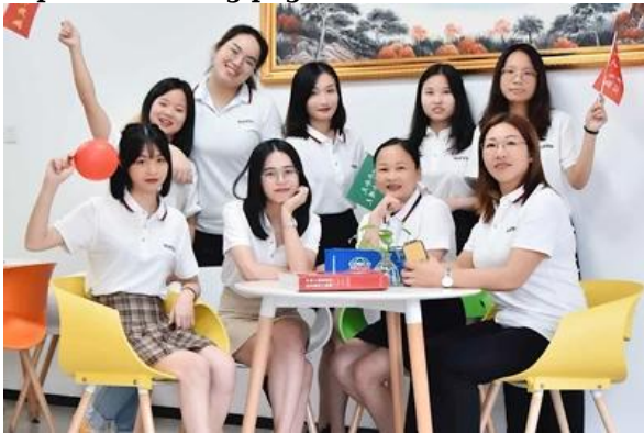
departamento ng operasyon