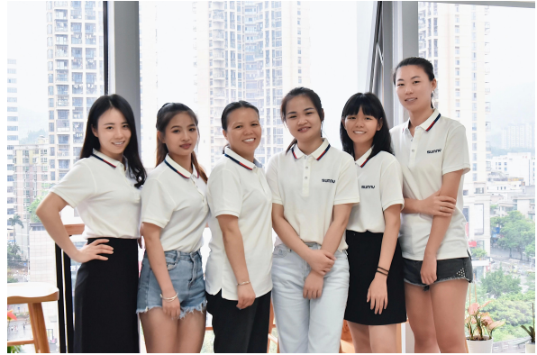
Kagawaran ng marketing