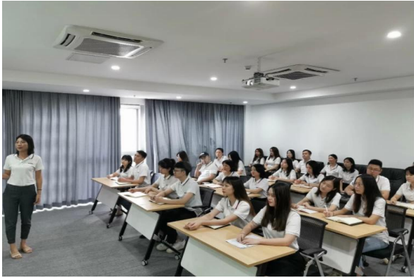
departamento ng pagbebenta

ang target natin ay Pasimplehin ang iyong trabaho at i-save ang iyong mga gastos.