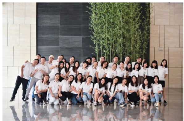
Hongmingda Logistics Team