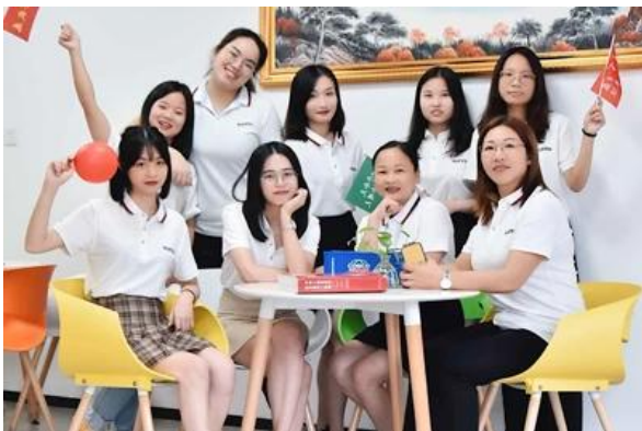
departamento ng operasyon